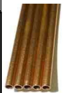
tubetti in Cu monoforo